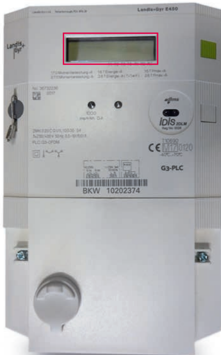
1.7.0 Aktuelle Wirkleistung Abgabe kW

Im Display werden die Registerwerte wie in der untenstehenden Tabelle ersichtlich alternierend im 15 Sekunden Takt angezeigt. Werte Abgabe 1.8.1 und 1.8.2 notieren (←), bei Produzenten zusätzlich 2.8.1 und 2.8.2.