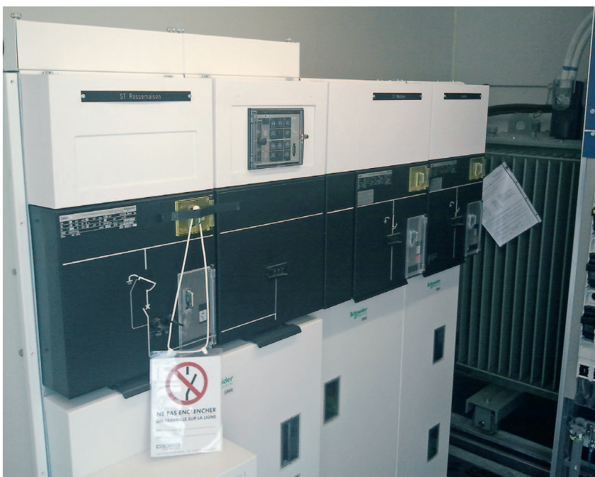
Schaltanlage mit alten Schutzrelais VIP300