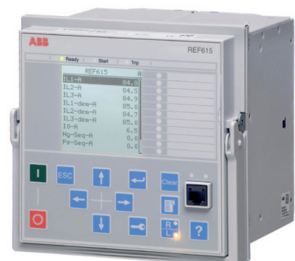
Im Projekt gewähltes ABB-Schutzrelais REF615