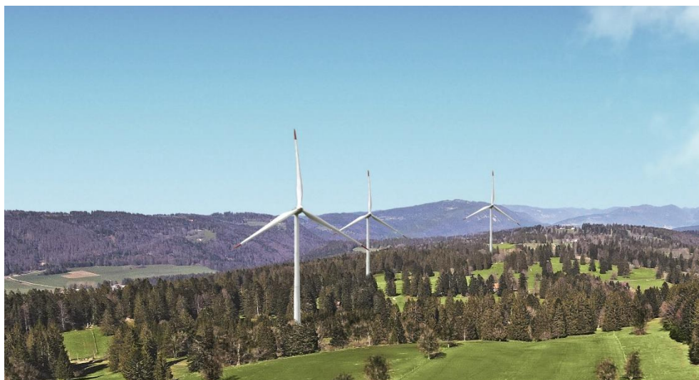
Fotomontage der drei neuen Windenergieanlagen.

Das Windprojekt «Jeanbrenin – Bises de Cortébert et Corgémont» im Berner Jura nimmt eine wichtige Hürde: Die zuständigen Fachstellen des Kantons Bern haben das Projekt genehmigt und alle Einsprachen abgewiesen. Frühestens im Herbst 2022 beginnen die Bauvorbereitungen.