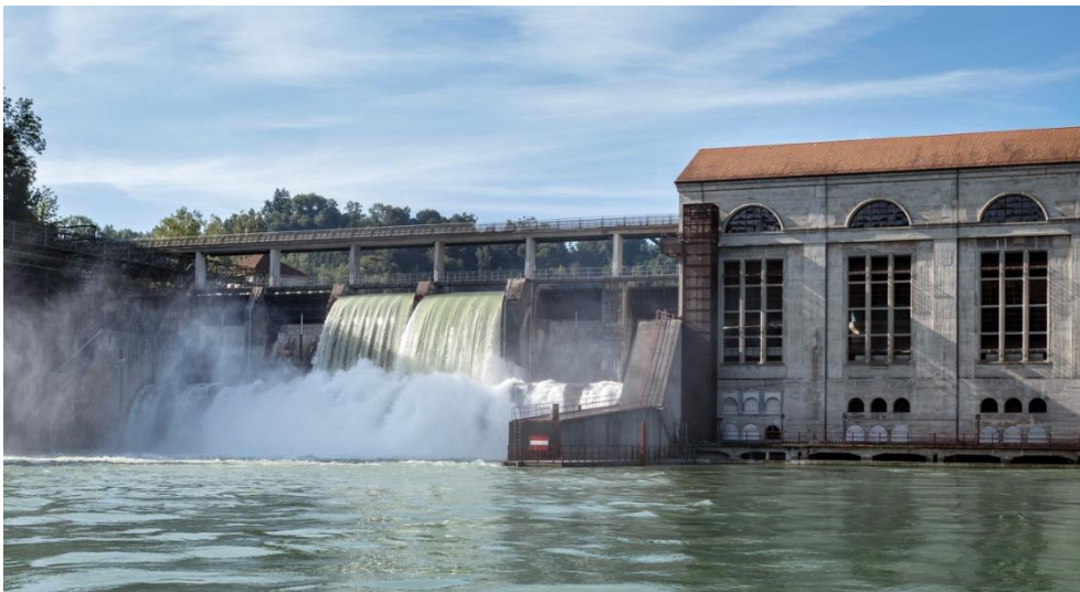
Centrale hydraulique de Mühleberg, BKW

Grâce à des coûts de production plus faibles, les tarifs de l'énergie pour l'approvisionnement de base de BKW vont baisser à partir du 1 er janvier 2025. En outre, BKW répercutera sur sa clientèle la baisse des coûts des prestations de services système généraux de Swissgrid et de la réserve d'électricité de la Confédération. Par ailleurs, BKW augmente la rémunération des garanties d'origine à 3,5 centimes par kilowattheure avec effet rétroactif au 1 er juillet 2024.