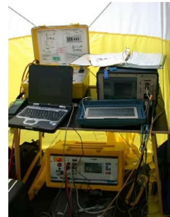
Messequipment im Einsatz

Die Messergebnisse werden in einem detaillierten Bericht dokumentiert.